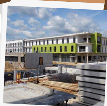
2011 Centre Hospitalier Alès Cévennes

Un retour à l'emploi de personnes rencontrant des difficultés d'insertion particulières