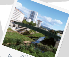
2013 Pont de Grabieux ANRU Alès