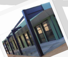
2012 Ecole Marignac Saint Christol les Alès