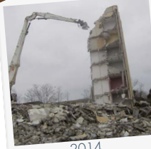
2014 Démolition Cévennes ANRU Alès