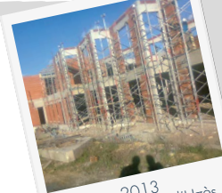
2013 EHPAD Hospital d'Uzès