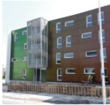
Construction 25 logements ANRU • Rochebelle (Alès)

33 354 heures d'insertion en 2015 sur les actions PLIE Cévenol