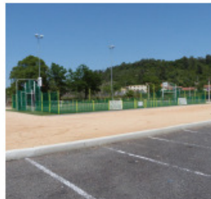
City Stade ANRU • Cévennes (Alès)