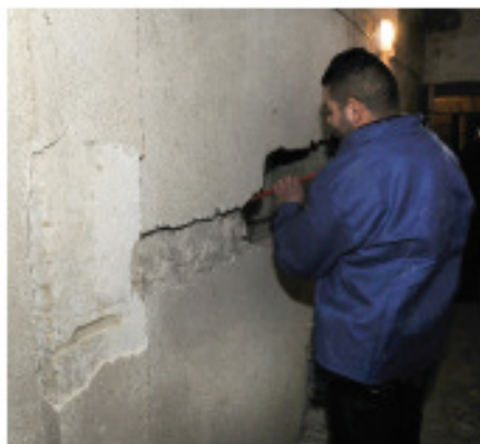
Logis Cévenol Alès