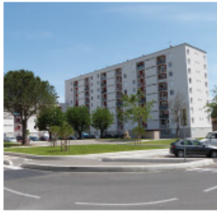
Réhabilitation ANRU • Cévennes (Alès)