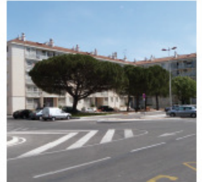
La Judie ANRU • Cévennes (Alès)